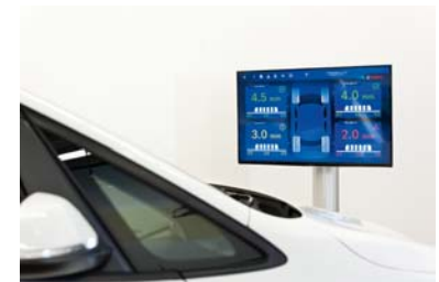
Drie display opties: Smart TV, Tablet of PC