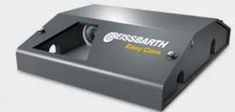
EasyCam tbv scannen kenteken (optioneel)